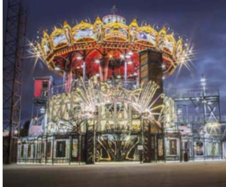
Le Carrousel des Mondes Marins