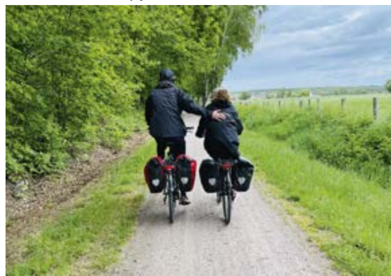
Traversée moderne d'un vieux pays à vélo

Mehr erfahren : Le Voyage permanent à vélo (Le Voyage permanent Mehr erfahren) www.loireavelo.fr – www.lavelodyssée.com