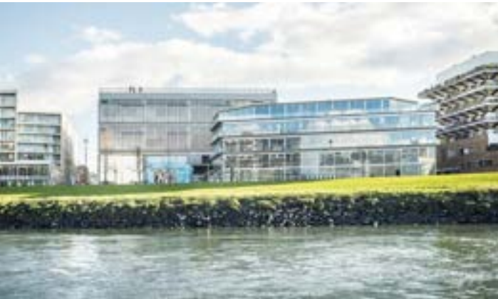
Ensa Nantes