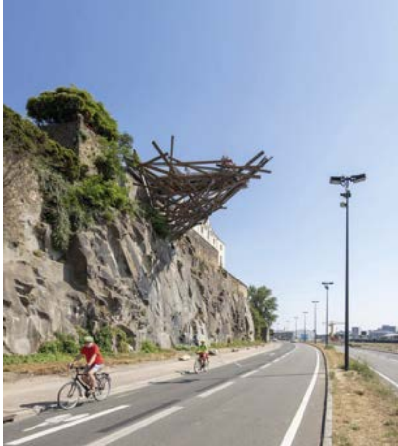
Belvédère de l'Hermitage, Tadashi Kawamata © Martin Argyroglo / LVAN

36.31 km – die ersten 10 Kilometer ohne Schwierigkeiten Folgen Sie den Ufern der Sèvre (10 km geschützter Radweg bis Vertou), die Sie dann hinter sich lassen, um durch das Anbaugebiet der Rebsorten Melon de Bourgogne und Folle Blanche zu radeln (Niveau „ich fahre regelmäßig“). Verkosten Sie auf dem Weg einen Muscadet und gelangen dann nach Clisson. Rückfahrt von Clisson nach Nantes mit dem Zug, Fahrradmitnahme möglich.