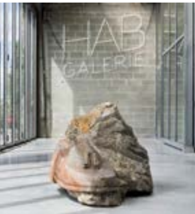
Hab Galerie