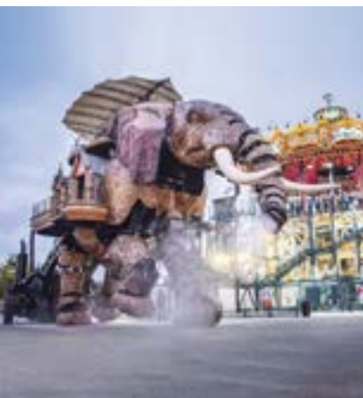
Le Grand Éléphant

seinen 30-minütigen Rundgängen nimmt er bis zu 50 Personen in seinem Bauch und auf seinem Rücken mit. Es ist schon ein Spektakel für sich, wenn sich die Metallkonstruktion, die Füße und Getriebe in Bewegung setzen. Diese Reise außerhalb der Zeit ist ganzjährig möglich (außer Januar und Anfang Februar). Der Grand Éléphant verbindet auf seinem Ausflug das Karussell mit den Hallen. Und seit 2018 ist er dank seines Hybrid-Motors der erste umweltfreundliche mechanische Dickhäuter!