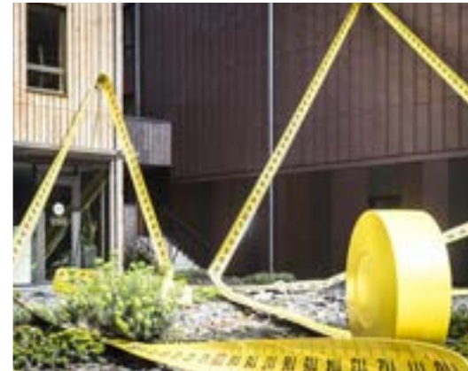
Mètre à ruban, Lilian Bourgeat