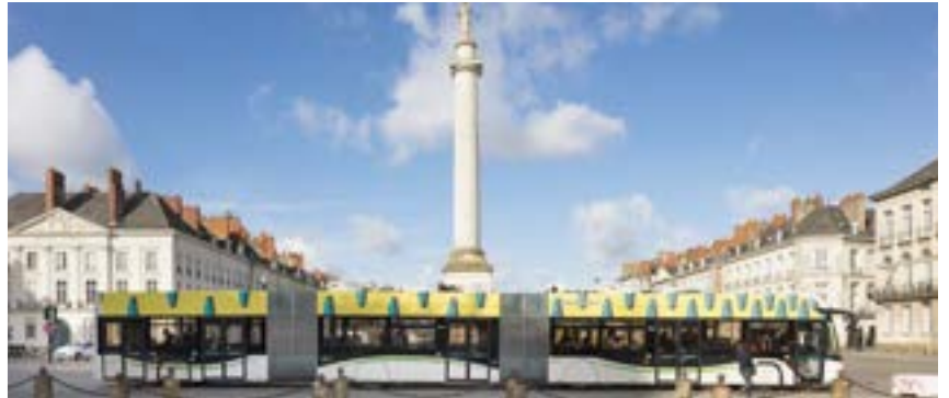
Busway néo Razzle-Dazzle, Samir Mougas

22 e.busways als mobile Leinwand für 22 Künstlerinnen und Künstler, die auf der Dachlinie der innovativen, 24 Meter langen Fahrzeuge einzigartige Werke schaffen.