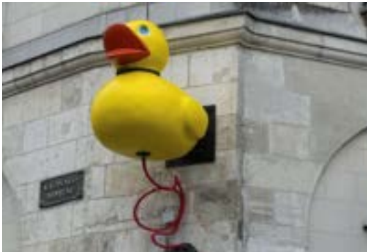
Viva Las Vegas! De l'art des enseignes

Seit 2014 bietet Le Voyage à Nantes den Händlern der Stadt an, ihre Ladenschilder von Künstlern neu interpretieren zu lassen.