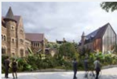
Futur musée Dobrée

Nach 13 Jahren öffnet das Museum Dobrée in einer neuen Version im Mai 2024 wieder die Türen des Palais im neo-mittelalterlichen Stil und des Manoirs aus dem 15. Jahrhundert. Der neue Museumsparcours ist chronologisch und thematisch aufgebaut und präsentiert 500 000 Jahre Geschichte anhand von über 2 000 Werken von der Prähistorie bis zum 20. Jahrhundert (aus einem Fundus von 135 000 Objekten), darunter das Reliquiar der Anne de Bretagne. Insgesamt 2000 m 2 für die Dauerausstellungen, 400 m 2 für temporäre Ausstellungen, eine begrünte Promenade, ein Park im Nanteser Industriestil... Thomas Dobrée vermachte 1895 sein Anwesen und seine umfangreiche Sammlung dem Département Loire-Atlantique.