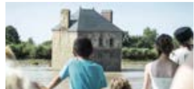
KREUZFAHRTEN AUF DER LOIRE ESTUAIRE NANTES <> SAINT-NAZAIRE