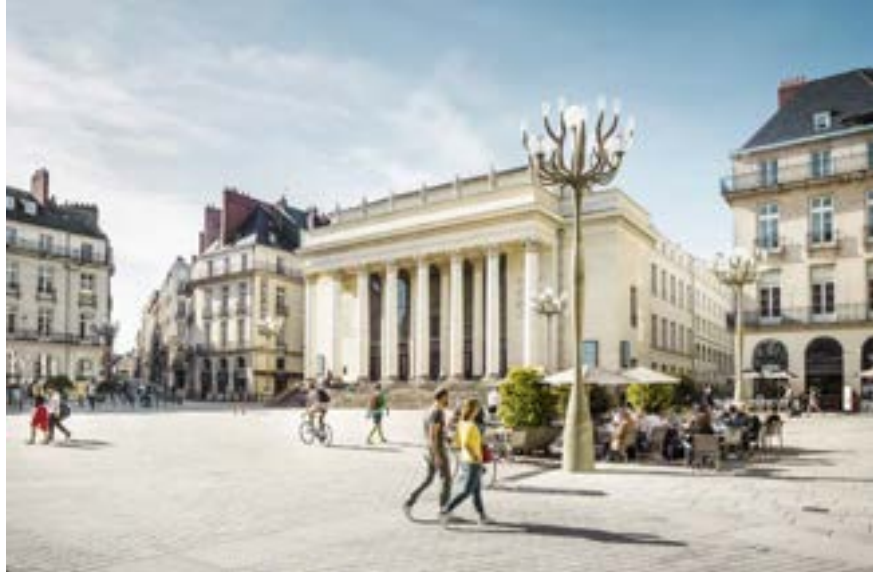
Opéra Graslin