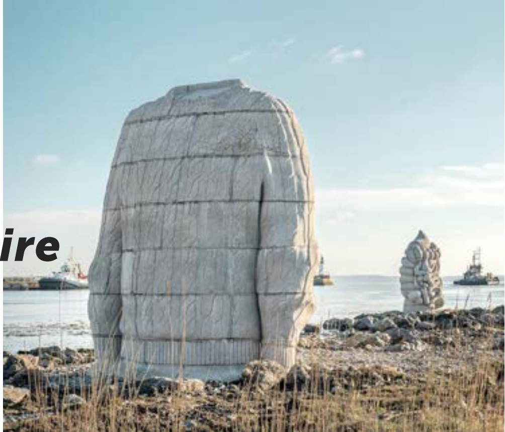
Le pied, le pull-over et le système digestif, Daniel Dewar & Grégory Gicquel

33 frei zugängliche Werke laden dazu ein, eher untypische Orte (eine Betonfabrik für Le Pendule von Roman Signer etc.) und sehenswerte Gegenden im Mündungsgebiet der Loire zu entdecken (Feuchtwiesen und Röhricht von Lavau-sur-Loire für L'Observatoire von Tadashi Kawamata). Einige Installationen offenbaren sich eher bei Einbruch der Nacht, wenn sie beginnen, die Stadt mit ihrer leuchtenden Poesie zu erfüllen. ( Les Anneaux von D. Buren und P. Bouchain, De Temps en Temps von François Morellet...). Im Rahmen des Spaziergangs Le Voyage permanent , l'Île de Nantes kann sich das Publikum in Begleitung eines Stadtführers zur Entdeckung eines Teils der in Nantes vorhandenen Werke aufmachen (siehe Kalender der Führungen von Le Voyage à Nantes ). 2014 hat das Beaux-Arts Magazine Estuaire in seine Sammlung „ 30 Jahre, 30 Werke, 30 Künstler, die die Kunst verändert haben “ aufgenommen. Sieben Jahre nach der Errichtung der ersten Werke wurde dieses verstreute Kunstwerk damit bereits zu einer Referenz.