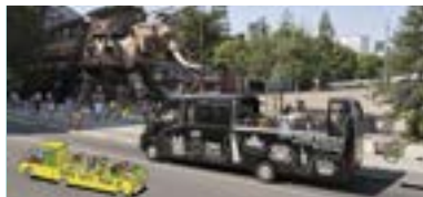
CITY TOUR NANTES