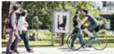
EIN TAG FAHRRADMIETE