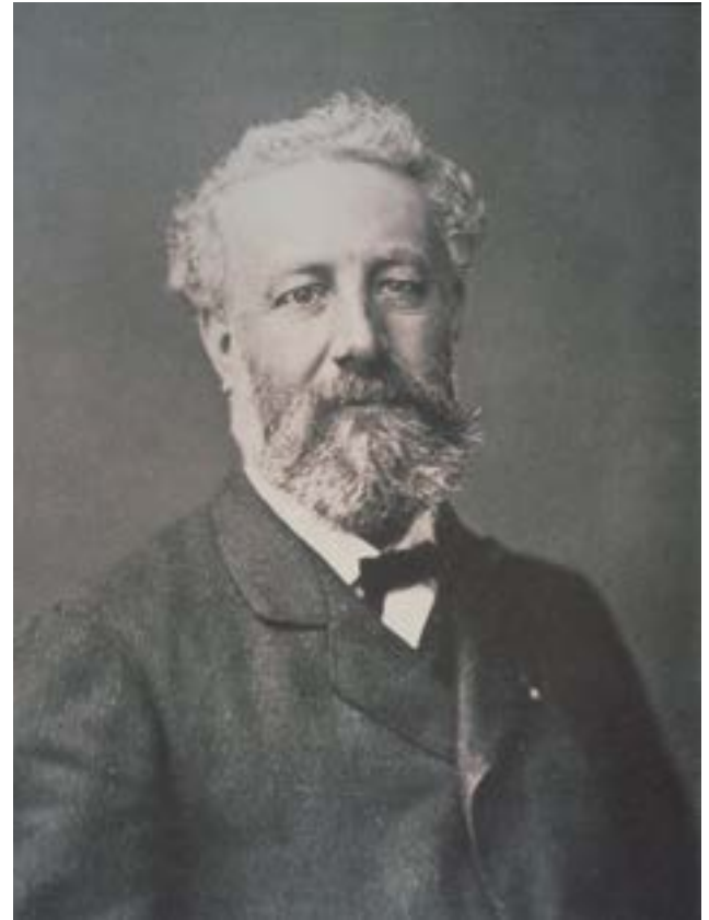
Portrait de Jules Verne par Nadar

Suche nach Wahrheit. In Ein Kapitän von 15 Jahren (1878) geht Jules Verne klar auf das Thema Sklaverei ein. Damit berührt er mutig und ohne Umwege ein Tabu der damaligen Literatur. Seine Heimatstadt ist die erste, die sich mit ihrer dunklen Vergangenheit auseinandersetzt und den Weg zu einer echten Erinnerungsarbeit aufzeigt (S. 12).