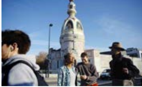
La Tour Lu