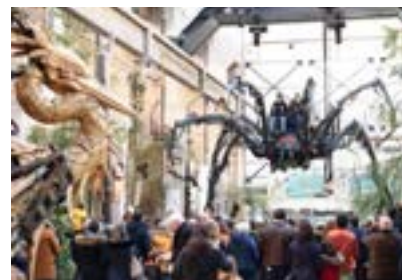
La Galerie des Machines

Die Galerie ist als Labor konzipiert und als Ort lebender Kunst. Sie setzt unterschiedliche Maschinen in Szene, die zum Ökosystem Wald gehören: Die Riesenameise wandert auf und ab, der Reiher mit seinen 8 Metern Spannweite erhebt sich in die Luft, das 2 Meter lange Chamäleon bewegt sich auf seinem Ast