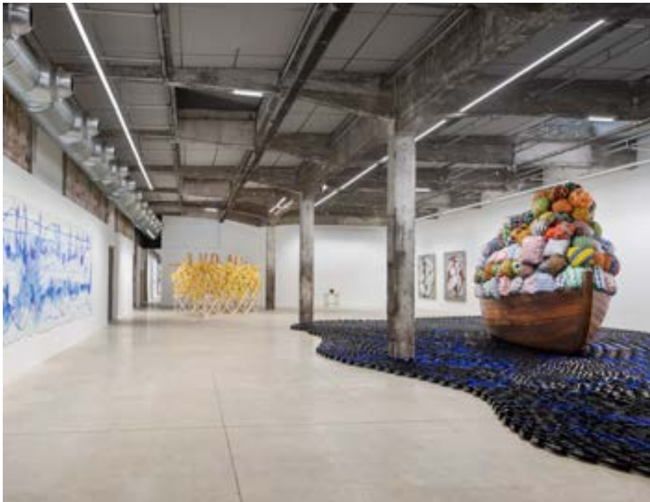
Hab Galerie, Ausstellung Barthélémy Togo, Habiter la Terre