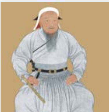
Portrait de Gengis Khan