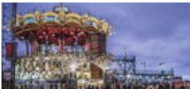
LES MACHINES DE L'ÎLE : GALERIE DES MACHINES ODER LE CARROUSEL DES MONDES MARINS