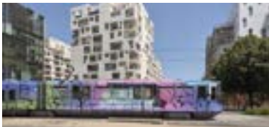
FLUGHAFEN-ZUBRINGER - ÖFFENTLICHE VERKEHRS- MITTEL FREIER ZUGANG - PARK&RIDE-PLÄTZE