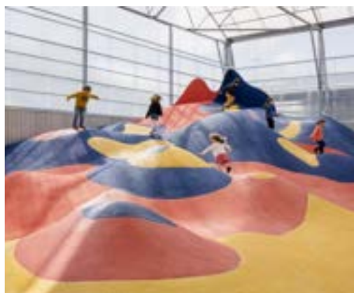
La Colline, Appelle-moi papa, La Cantine du Voyage