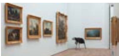
MUSÉE D'ARTS DE NANTES UND AUSSTELLUNGEN