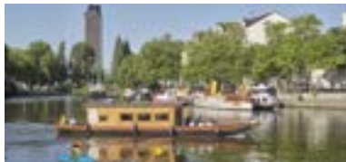
FLUSSFAHRTEN AUF DER ERDRE UND TOUR DER ILE DE NANTES AUF DER LOIRE