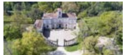
DOMÄNE LA GARENNE-LE MOT, MIT FÜHRUNGEN, GÉTIGNÉ