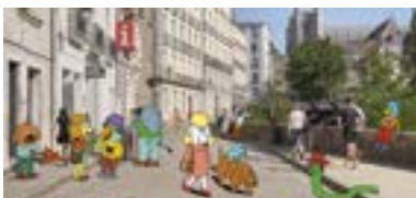
FÜHRUNGEN LE VOYAGE À NANTES ODER AUDIOGUIDE-VERLEIH