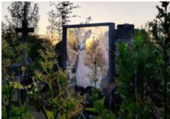
Miroirs des temps, Pascal Convert, Maître verrier Olivier Juteau