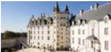
CHÂTEAU DES DUCS DE BRETAGNE / MUSÉE D'HISTOIRE DE NANTES UND AUSSTELLUNGEN