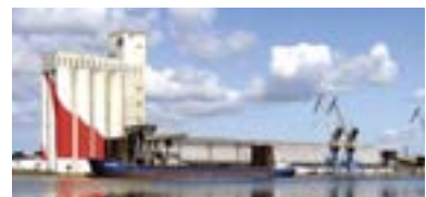
ESCAL'ATLANTIC, EOL (WINDZENTRUM), ÖKOMUSEUM, UNTERSEEBOOT ESPADON, SAINT-NAZAIRE