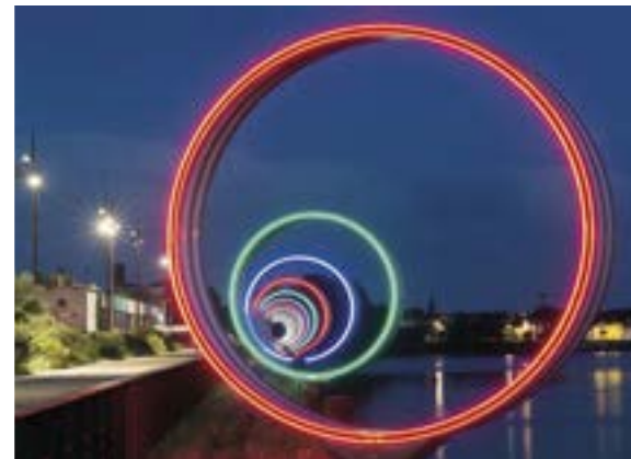
Les Anneaux, D. Buren et P. Bouchain