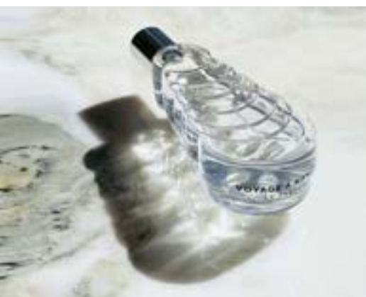
Voyage à Nantes, Le Parfum