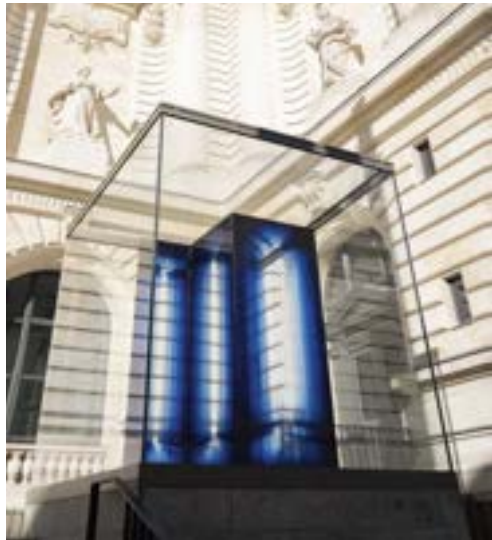
Dédale, Justin Weiler. Musée d'arts de Nantes