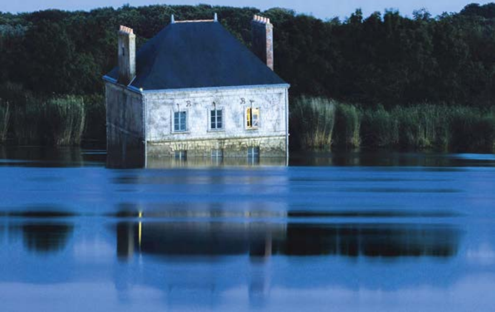
Jean-Luc Courcoult, La Maison dans la Loire , Couëron, création pérenne Estuaire 2007

Élisée Reclus (1830-1905), französischer Geograf.