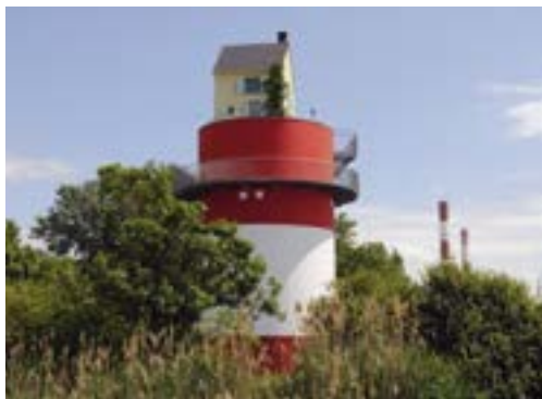
Villa Cheminée, Tatzu Nishi. Cordemais

Neben der Kollektion in Zusammenarbeit mit den Hotels bietet Le Voyage à Nantes auch seine eigenen ungewöhnlichen Unterkünfte in Nantes und entlang der Loire-Mündung an.