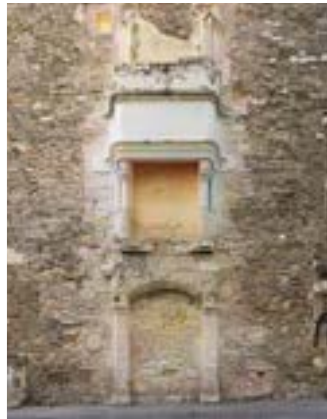
Le temps entre les pierres, Flora Moscovici