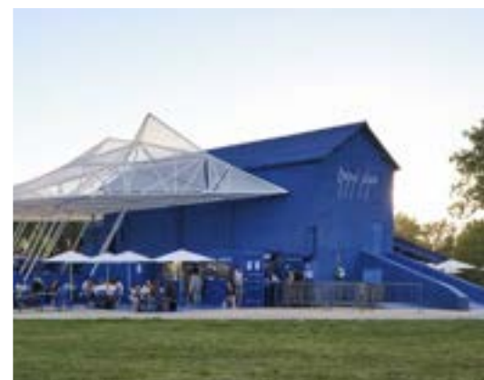
Station Nuage, Yokyok