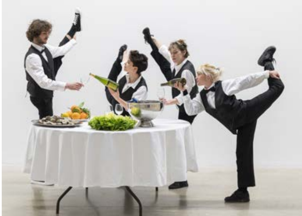
VAN Service Affaires

Außerdem: Passage Pommeraye (max. 1200 Personen), Le Jardin des Plantes (50 Personen). La Cantine du Voyage (200 Personen) und die MiN (800 Personen).