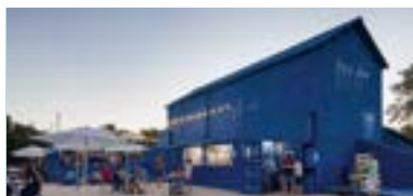
SNACKS, KAFFEE UND APÉRITIFS