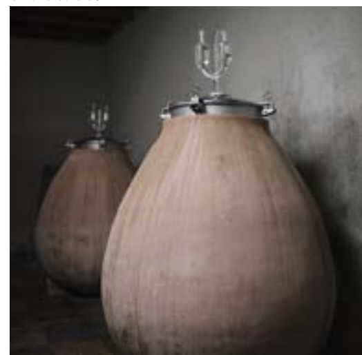
Eiförmige Tanks, Domaine Bonnet-Huteau

Der gros-plant du Pays Nantais, die Coteaux d'Ancenis stellen, mit unterschiedlichen Rebsorten, eine sehr schöne Bandbreite von Loire-Weinen dar, die gut zu den Nanteser Gerichten passen.