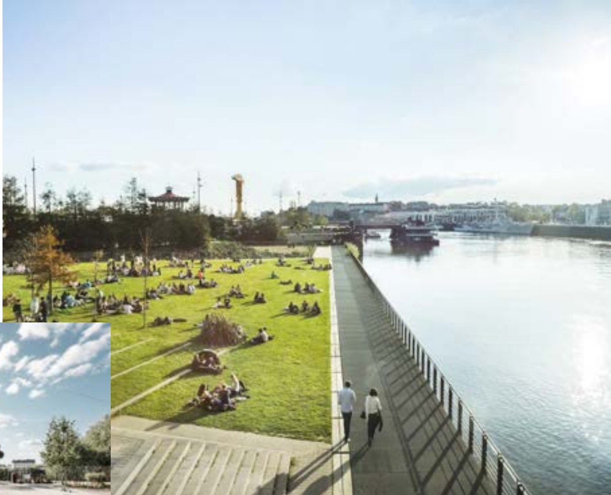
Parc des Chantiers, île de Nantes