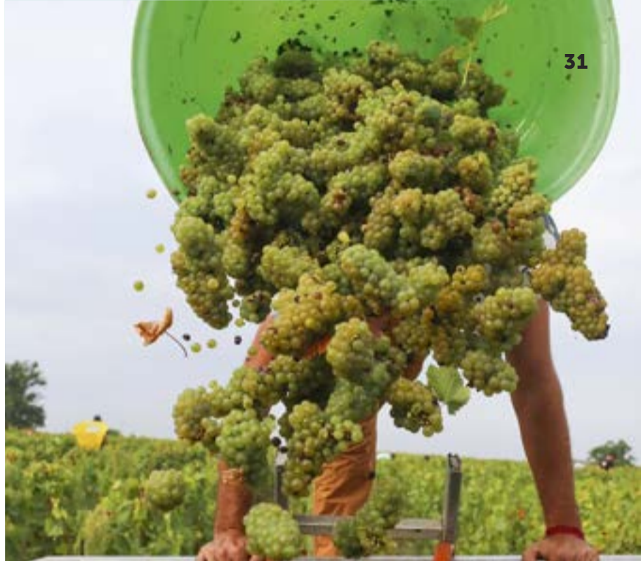
Vendanges, Le Voyage dans le Vignoble

Den muscadet als ganz typischen Weißwein kennt und schätzt man in aller Welt: Er steht auf den Karten der besten Restaurants - Noma in Kopenhagen, Balthazar in New York, Arpège in Paris...- und wird in mehr als 93 Länder exportiert. Das muscadet-Gebiet befindet sich am westlichen Rand des Weinbaugebiets Val de Loire, der drittgrößten AOC-Weinregion Frankreichs (Appellation d'Origine Contrôlée) auf fast 8.000 ha und mit mehr als 450 Weingütern. Seit 2015 führt eine önotouristische und „weinkünstlerische“ Route durch diese Landschaften südlich der Loire: Voyage dans le Vignoble .