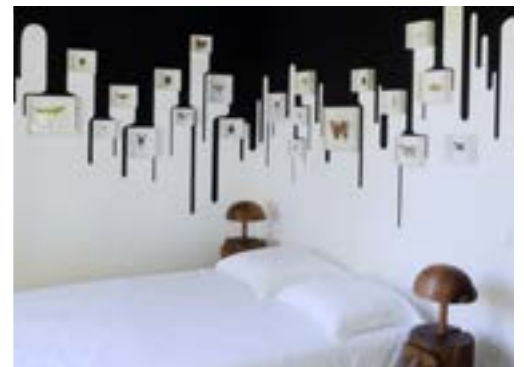
Chambre d'artiste, Mrzyk et Moriceau. Saint-Jean-de-Boiseau