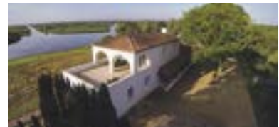
DAS HAUS AM SEE VON GRAND-LIEU