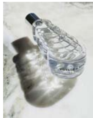
Voyage à Nantes, Le Parfum

ein Werk von Bertrand Duchaufour (Unisex-Parfum – 37,50 € inkl. MWSt.).